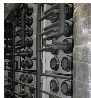
Abb.: Ausschnitt der Anlage mit CAPITO Pufferspeichern

Mittels eines speziell entwickelten Simulationsprogramms für das dynamische Verhalten von Pufferspeichern wurden im