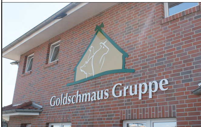
Abb.: Böseler Goldschmaus, Garrel

Auszug einer Objektreportage, Wärmerückgewinnung zur Warmwasserbereitung in Garrel