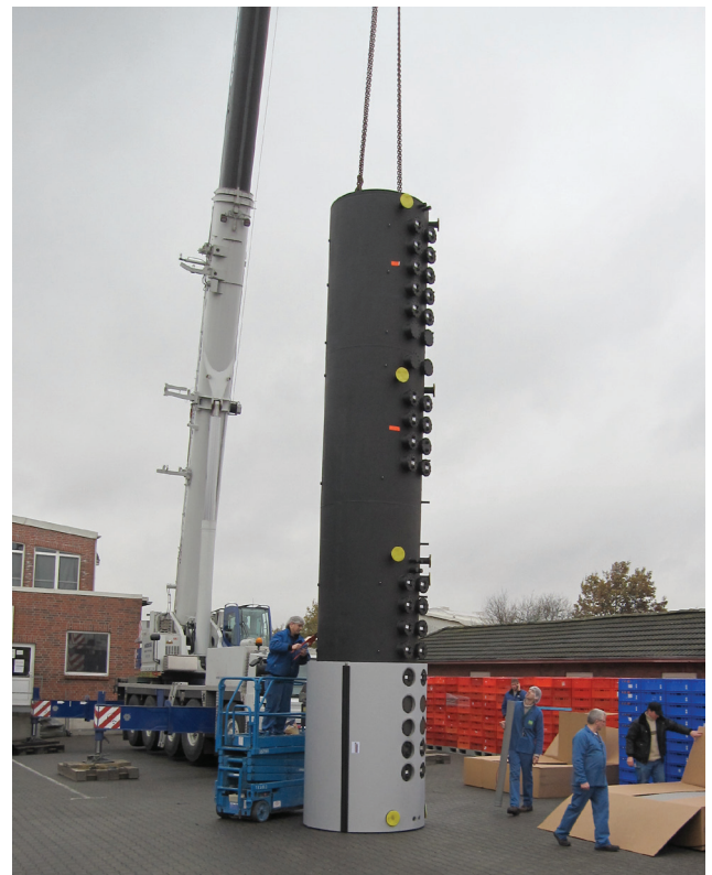
Abb.: Einbau erfolgte aufgrund der Größe der 6 Pufferspeicher mit Hilfe eines Krans durch das Dach des Gebäudes

Mit der intelligenten CAPITO-Technologie können Pufferspeicher flexibel und individuell für jedes Bauvorhaben geplant und gefertigt werden. Fundiertes und praxisgerechtes Ingenieur-Wissen sowie ein speziell entwickeltes Simulationsprogramm für das dynamische Verhalten von Pufferspeichern geben Sicherheit bei Planung und Realisierung von Projekten.