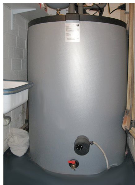
Abb.: CAPITO Pufferspeicher F-PD 250 Installation auf engstem Raum

Durch den Einsatz eines CAPITO Speichers vom Typ F-PD mit 250 Liter Puffervolumen konnte diesen Anforderungen einfach Rechnung getragen werden.