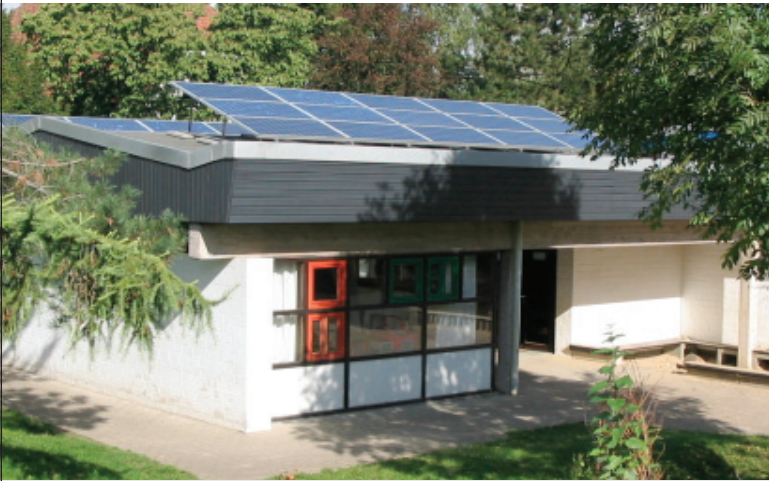
Abb.: Kita „Unterm Regenbogen“, Heiden