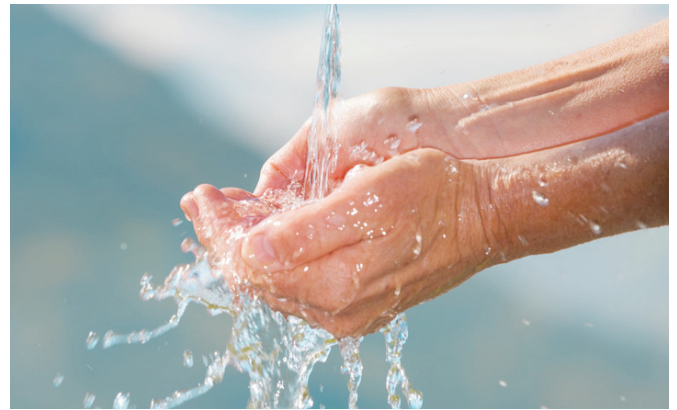
Abb.: Frisches Wasser (Fotolia)

Der robuste Rippenrohrwärmetauscher gewährleistet durch seine Bauform und Ausführung optimale Selbstreinigungseigenschaften und sorgt somit für einen langen, störungsfreien Betrieb der gesamten Anlage. Im Bedarfsfall könnte der Wärmetauscher im eingebauten Zustand entkalkt werden, selbst ein schneller kompletter Austausch des Wärmetauschers wäre denkbar.