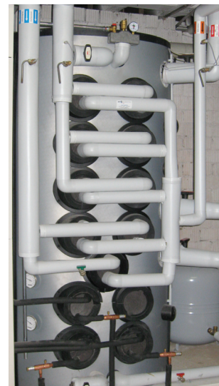
Abb.: CAPITO M-PD 1500, Haupthaus

Die Energie der Abwärme wird über die drei Kältemittel-Wärmetauscher im unteren Bereich des Pufferspeichers eingelagert. Die Vorwärmetauscher wärmen das Trinkwasser vor und die Nacherhitzung erfolgt in den Trinkwasser-Wärmetauschern im oberen Bereich. Der Ölkessel sorgt für die notwendigen hohen Temperaturen im oberen Pufferbereich sowie für eine komfortable Zapfleistung. Der Pufferspeicher M-PD ist auch für die Anbindung von BHKWs vorgerüstet, sodass jederzeit bei Bedarf die Heizungsanlage um ein BHKW erweitert werden kann.