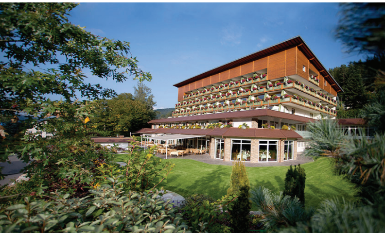
Abb.: Enzthalhotel, Enzklösterle