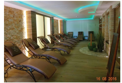
Abb.: Wellness- und Saunabereich

und Keimvermehrung werden mit dem CAPITO Trinkwasser-System reduziert. Sauberes und frisches Wasser steht jederzeit auch in ausreichender Menge zu Verfügung.