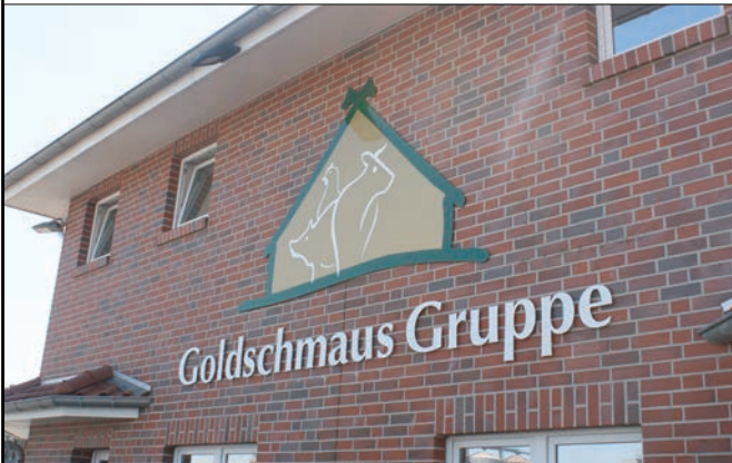
Abb.: Böseler Goldschmaus, Garrel

Auszug einer Objektreportage, Wärmerückgewinnung zur Warmwasserbereitung in Garrel