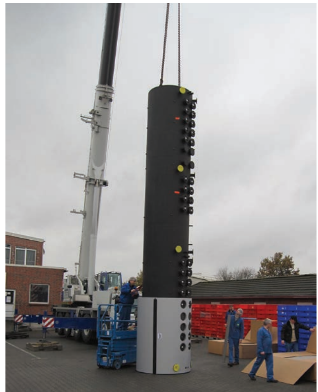
Abb.: Einbau erfolgte aufgrund der Größe der 6 Pufferspeicher mit Hilfe eines Krans durch das Dach des Gebäudes

Mit der intelligenten CAPITO -Technologie können Pufferspeicher flexibel und individuell für jedes Bauvorhaben geplant und gefertigt werden. Fundiertes und praxisgerechtes Ingenieur-Wissen sowie ein speziell entwickeltes Simulationsprogramm für das dynamische Verhalten von Pufferspeichern geben Sicherheit bei Planung und Realisierung von Projekten.